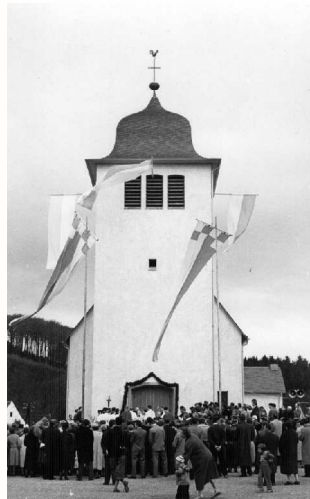
St. Josef Stübbeken (1957)